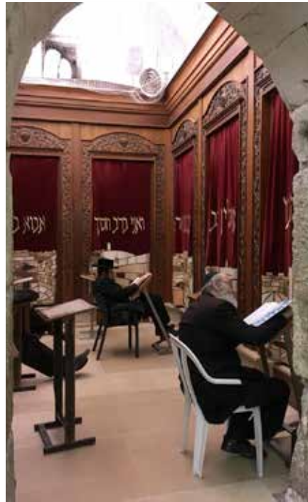
Synagoge an der Klagemauer

Die Überheblichkeit der Kirche gegenüber Israel und die Substitutionstheologie, wonach Israel verworfen sei und die Kirche sich als das wahre Israel sieht, hat dazu beigetragen, dass Juden über viele Jahrhunderte ausgegrenzt und verfolgt wurden. Als Christen sind wir aufgefordert, jeglichem Antijudaismus und Antizionismus zu wehren und uns für Frieden und Versöhnung einzusetzen.