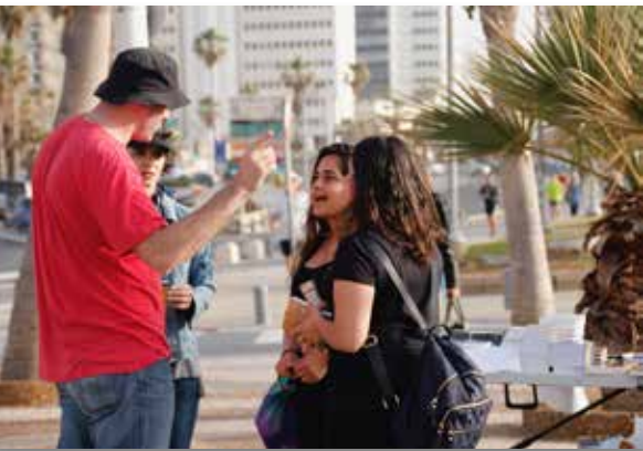
Gespräch über den Messias in Tel Aviv

können wir diesem Volk, das Gott so sehr liebt, an dem Gott so sehr hängt, nicht gleichgültig gegenüberstehen. Was von uns Christen heute gefordert ist, und was Israel mehr denn je braucht, ist eine tiefere Sicht. Dass wir dieses Volk nicht nur sehen im Zusammenhang mit tagespolitischen Ereignissen. Dass wir Israel im Zusammenhang mit seiner über 3000-jährigen Geschichte sehen, seiner Geschichte mit Gott, mit demselben Gott, an den wir glauben. Das heißt nichts anderes, als dass wir versuchen, das jüdische Volk mit den Augen Gottes zu sehen. Und Gott sieht sein Volk an mit Augen voller Liebe. Und das verbindet uns für immer mit unseren jüdischen Geschwistern. Diese Verbindung zu stärken, wo wir können, das ist unsere Aufgabe für die Zukunft.